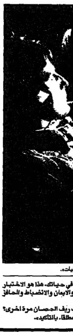
للشاعر كريستوفر ريف الذي اشهر بأدوار سوبرمان يخرج فيلمه الاخير من فقرة العماليد.

بيفرلي هيلز، كاليفورنيا - من جنيف بازل كريستوفر ريف يحاول ان يخذ قسطاً من الراحة في غرقة في الفنون، وهو جالس على الكرسي المتحرك في باب الشرقية ملاعب في رؤوس الاشجار التقامية في انسيما. انظر الى الاسترخاء الممثل الذي تحول الى مسخر، بعد اسبوع من العمل المضني والمتشاقق للمحترفين في نفس الوقت، وكان قد حضر سابقاً العرض الاول لفيلمه "In the Gloaming" مع عدد كبير من نجوم السينما، وكان قد وضع يده على نوب الشهرة في هوليوود اليوم بيبدو ريف ايقياً ببدلته الزرقاء وقميصه الأزرق، وقد كان قد سجل تده مقابلة تلفزيونية مع لاري كينغ، وبعد ساعات قليلة سيخرج ايضا مع جاي ليدو في برنامج "The Tonight Show" مولداً ليدو تلمع ساعة بظهر اوكي. ويصوت للممثل الشاب البالغ من العمر 44 عاماً والشاقي التام، فيما تتضرر له مرضه كوي من الشاقي التام. ويبدأ ريف بالاشارة الى ان الموضوع هو الذي جذبه لصنع فيلم In the Gloaming الذي يستغرق عرضه ساعة واحدة ببطولة روبرت شون ليبارد في دور بوليفي الاكبر. وتكسب غلين كلوز وديفيد سترالين دور والديه غير الطبيعيين، فيما تؤدي بريت فوندا دور شقيقته الباردة ووبي فولدرس دور العرصة الحكيمة. ويشدد ريف على ان الفيلم ليس عن مرض الاكبر، بل الحقيقة ان الكلمة لا تكفي مرة واحدة في الفيلم، بل انه عن المشاهدة والصالحه في وجه الخسارة العظيمة، وطوره هذا الشاب لي يربطه بربع سنوات من العمل عن وعده تسبب تخفيرا، معظما في حياته، وانا اعلم ان الفيلم هو عن رب الصعق في علاقته مع امله، وليس عن موت رجل في مقبل العمر. في نهاية عرض الفيلم في قاعة رابطة المخرجين الأمريكيين قوبل ريف بالاحترام والتشجيع، ويقول انه شعر بالارتياح لحسن استقبال الفيلم والوقوف الجيّد على درب الشهرة، وذلك بعرض الوقت الذي امضيه